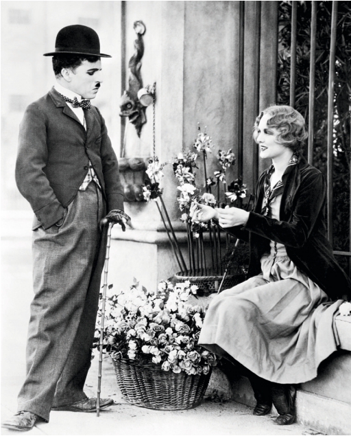
Still aus Film